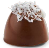
Hindistan Cevizli - Fındıklı ikolata