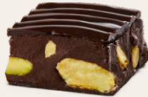
Fıstıklı Pralinli Çikolata