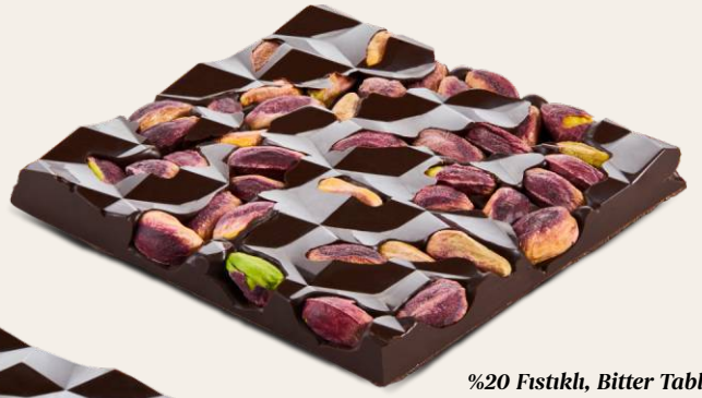
%20 Fıstıklı, Bitter Tablet