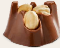
Fındıklı Sütlü Bonbon