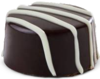
Badem Ezmeli Bitter ikolata