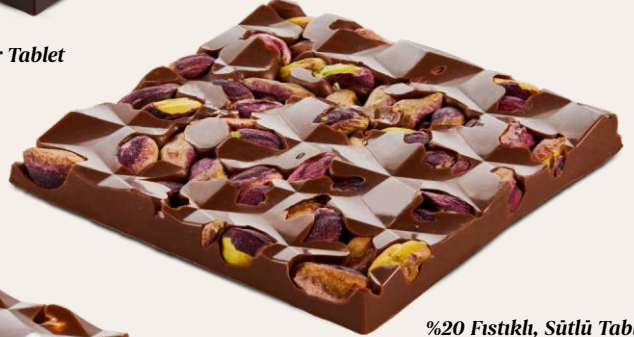
%20 Fıstıklı, Sütü Tablet