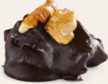
İncirli - Cevizli Bitter Çikolata