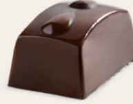
Limonlu Bitter Çikolata