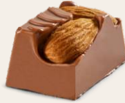
Bademli Sütlü Bonbon