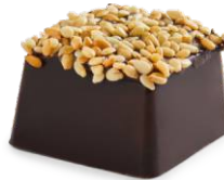
Tahinli Bitter ikolata