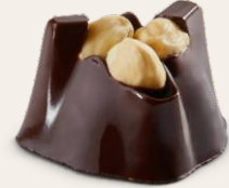
Fındıklı Bitter Bonbon