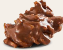
Sütlü Badem Rocher