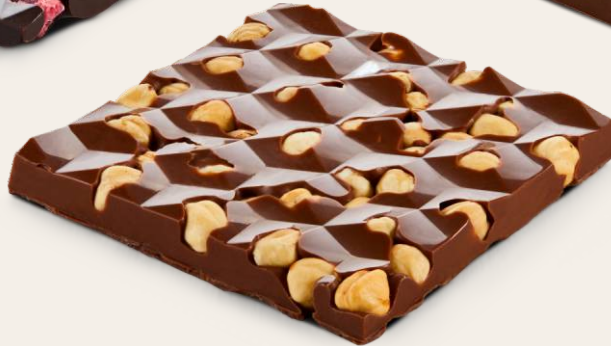
%20 Fındıklı, Sütü Tablet