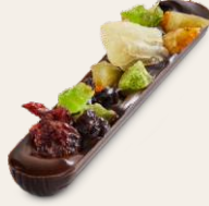
Meyveli Bitter Çubukları