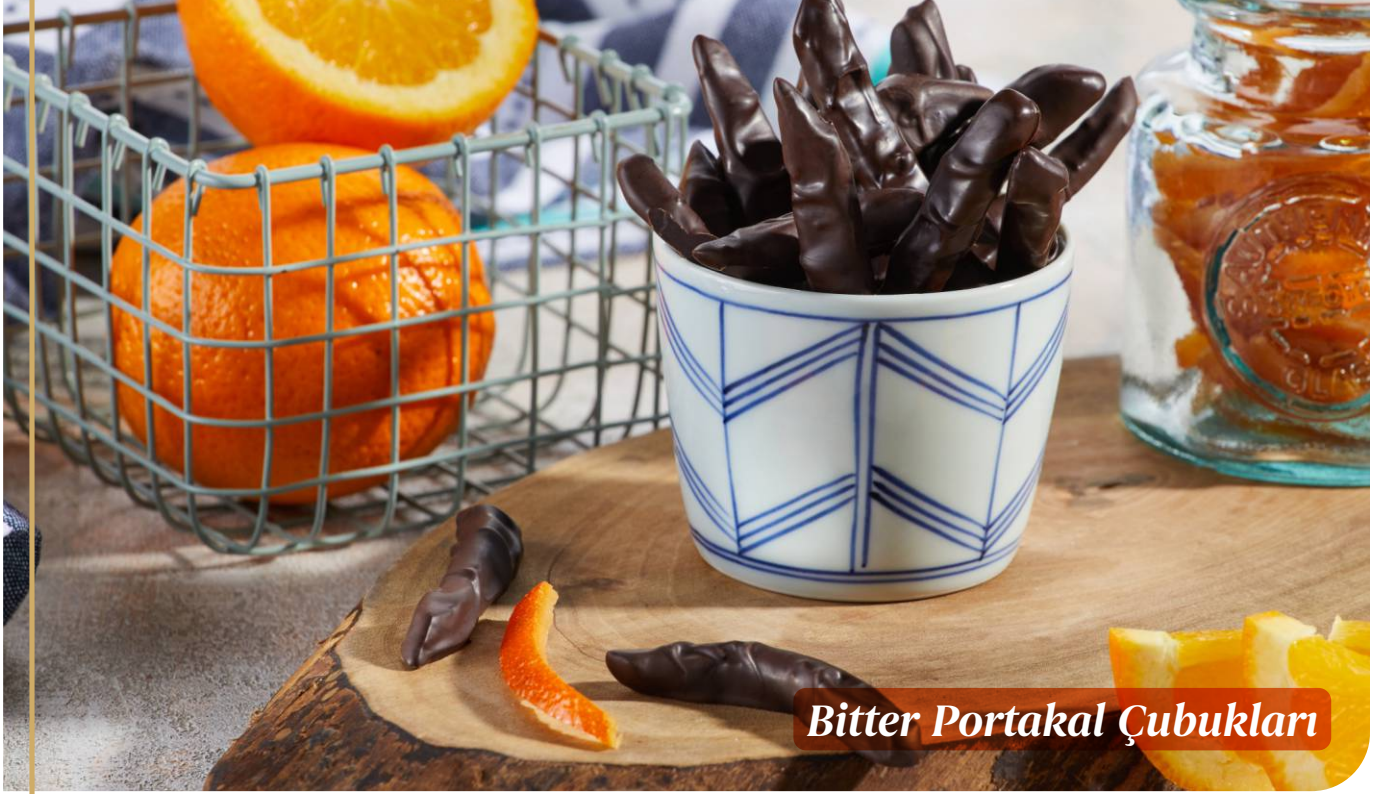
Bitter Portakal ubukları