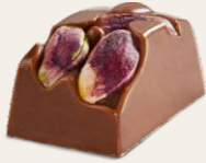
Fıstıklı Sütlü Bonbon