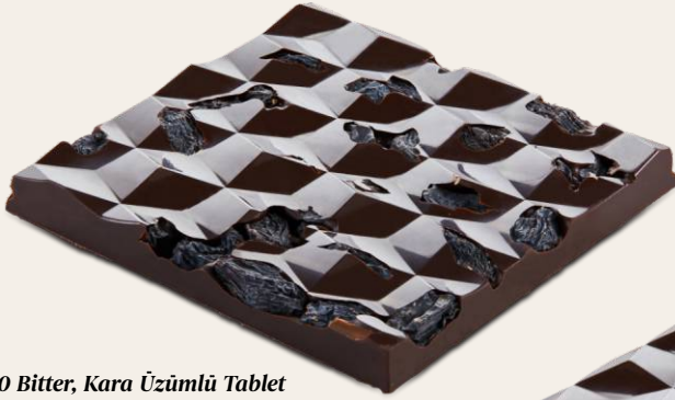
%70 Bitter, Kara Üzümlü Tablet