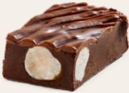
Fındıklı Pralinli Çikolata