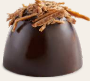
Lotus - Karamel Çikolata