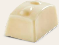
Limonlu Beyaz Çikolata