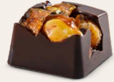
Bitter Çikolata Kaplı Krokan