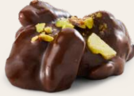
Bitter Fıstık Rocher